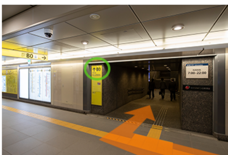
从检票口出来后, 前往B0出口