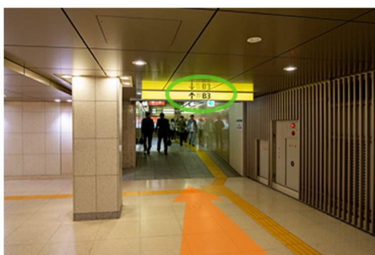
从检票口出来后, 前往B3出口方向