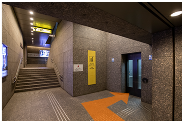
階段手前右側にエレベーターがあります