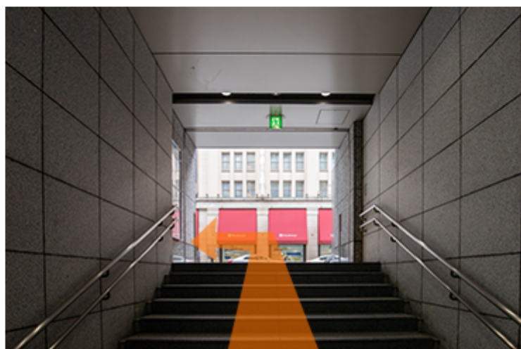
B3出口を出たら左に曲がります